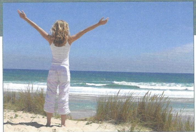
Libérée de la cigarette et des pollutions ?

J'ai 67 ans et je fume depuis l'âge de 20 ans, j'ai souvent eu le désir d'arrêter et j'ai essayé tous les artifices chimiques que la pharmacologie moderne a pu apporter sans aucun résultat. En essayant le Bol d'air®, je pensais d'abord à alimenter mon corps en oxygène ; mais au fur et à mesure de mes séances, mon envie de fumer s'est éteinte d'elle-même. J'arrive à ne fumer que les cigarettes qui me plaisent et ma consommation journalière a diminué de façon significative (je suis passé de 30 cigarettes à 10 par jour), sans efforts, sans prise de poids, sans effet de manque et, rien que pour cela, je continuerai à utiliser le Bol d'air Jacquier®. »