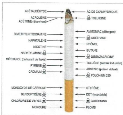
Plus de 3 000 substances toxiques composent la cigarette

Les cils vibratiles ne peuvent plus remplir leur rôle, la fumée d'une seule cigarette les immobilise pendant 4 heures. Le résultat ? Mucus et bactéries s'accumulent, favorisant l'apparition d'infections pulmonaires. C'est le blocage des mécanismes de défense de notre appareil respiratoire.